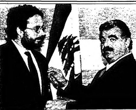
قائد الميراثين يدين مكتب المصالح العمومي في لبنان وسام الأرز الصهيوني

حقوق الإنسان في الإسلام والمسيحية محور ندوة أكاديمية... (Main article text about the academic conference)